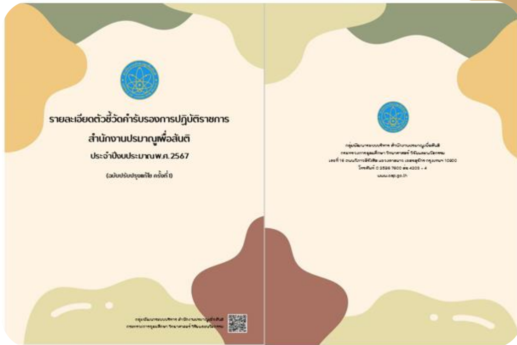
ภาพที่ 2 เล่มรายละเอียดตัวชี้วัดการรับรองการปฏิบัติราชการ ประจำปีงบประมาณ พ.ศ. 2567