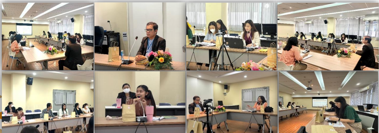
ภาพที่ 3 การประชุมคณะทำงานติดตามและประเมินผลการปฏิบัติราชการตามคำรับรองการปฏิบัติราชการของสำนักงานปรมาณูเพื่อสันติ

2.3.3 กพร. จัดประชุมคณะทำงานฯ (เฉพาะการประเมินรอบ 6 เดือน และรอบ 12 เดือน) เพื่อกลั่นกรองผลการดำเนินงานให้ถูกต้องและเป็นไปตามเกณฑ์การประเมินก่อนนำเสนอผู้บริหารพิจารณาต่อไป