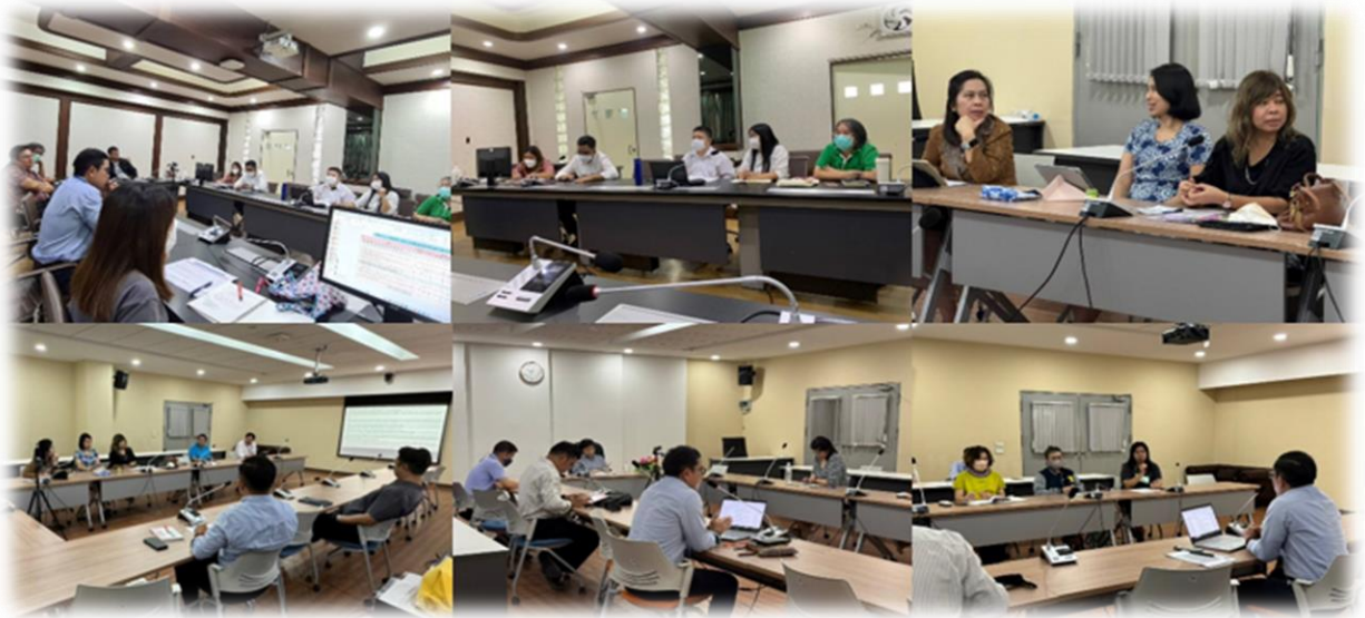
ภาพที่ 1 การประชุมหารือร่วมกับหน่วยงาน เพื่อกำหนดตัวชี้วัดคำรับรองการปฏิบัติราชการ ประจำปีงบประมาณ พ.ศ. 2567

2. กพร. ทหารี้อร่วมกับกอง/กลุ่มต่างๆ โดยได้เรียนเชิญ ผอ.กอง/กลุ่ม หัวหน้ากลุ่มงาน และ ผู้ปฏิบัติงานที่ได้รับมอบหมาย (Key Person) เข้าร่วมพิจารณา (ร่าง) ตัวชี้วัดคำรับรองการปฏิบัติราชการ ประจำปีงบประมาณ พ.ศ. 2567 และร่วมกันกำหนดรายละเอียดตัวชี้วัด น้ำหนัก ค่าเป้าหมาย และแนวทางการ ประเมินผล เพื่อสร้างความเข้าใจให้เป็นไปในทิศทางเดียวกัน