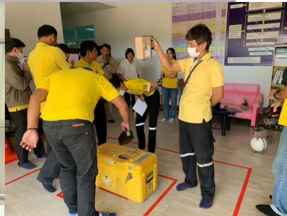
ใส่เสื้อเหลืองทุกวันจันทร์