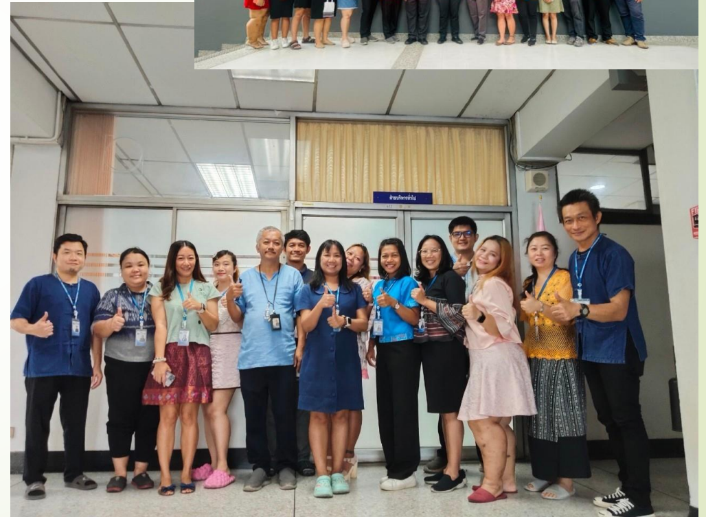
ใส่ผ้าไทยทุกวันศุกร์