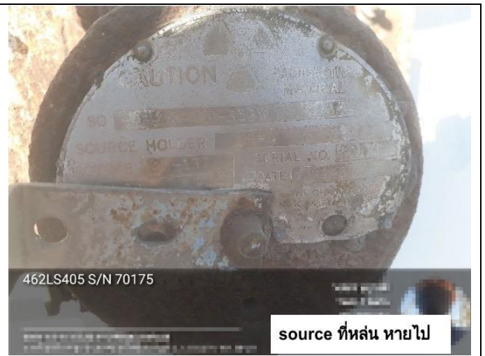
รูปภาพ ๑ก. ถ่ายเมื่อวันที่ ๒๑ ธันวาคม ๒๕๖๕