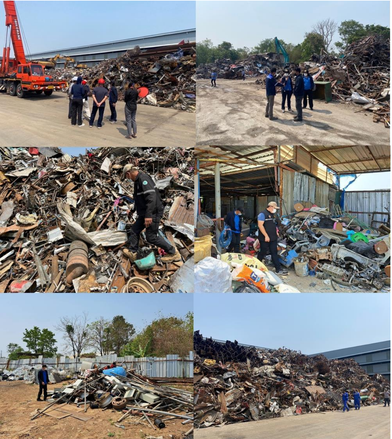
รูปภาพที่ ๔ แสดงการเข้าปฏิบัติงานของเจ้าหน้าที่ ปส. ในพื้นที่สถานประกอบการกิจการรับซื้อเศษโลหะและโรงหลอมเหล็กขนาดใหญ่จำนวน ๑๕ แห่ง

๒.๕ วันที่ ๑๔ มีนาคม ๒๕๖๖ เวลา ๑๕.๐๐ น. ผู้ว่าราชการจังหวัดปราจีนบุรี เลขานุการสำนักงานปริมาณเพื่อสันติ นายแพทย์สาธารณสุขจังหวัดปราจีนบุรี และตัวแทนบริษัทฯ ได้จัดแถลงข่าวต่อสื่อมวลชน เรื่องวัสดุกัมมันตรังสีซีเซียม-๑๓๗ (Cesium - ๑๓๗, Cs -๑๓๗) สูญหาย ดังรูปภาพที่ ๕