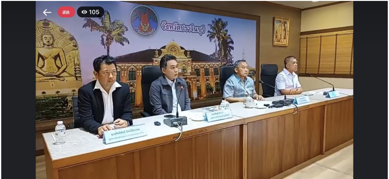
รูปภาพที่ ๕ การแถลงข่าวของผู้ว่าราชการจังหวัดปราจีนบุรี เลขาธิการสำนักงานปรมาณูเพื่อสันติ นายแพทย์สาธารณสุขจังหวัดปราจีนบุรี และตัวแทนบริษัทฯ ต่อสื่อมวลชน

๒.๖ วันที่ ๑๕ มีนาคม ๒๕๖๖ เจ้าหน้าที่ ปส. ร่วมกับเจ้าหน้าที่ฝ่ายปกครองอำเภอศรีมหาโพธิ์ ได้ร่วมกันปฏิบัติการค้นหาวัสดุกัมมันตรังสีซีซีเอ็ม-๑๓๗ สูญหาย โดยการเข้าตรวจสอบสถานประกอบกิจการรับซื้อเศษโลหะ จังหวัดฉะเชิงเทรา ดังรูปภาพที่ ๖