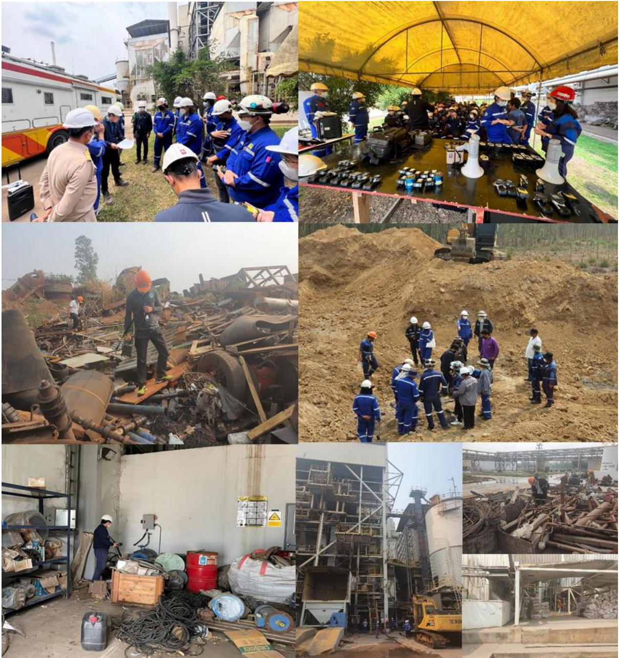
รูปภาพที่ ๓ แสดงการเข้าปฏิบัติงานของเจ้าหน้าที่ ปส. ร่วมกับเจ้าหน้าที่ที่เกี่ยวข้องในพื้นที่โรงงานฯ

๒.๔ วันที่ ๑๔ มีนาคม ๒๕๖๖ ปส. ร่วมกับเจ้าหน้าที่ฝ่ายปกครองอำเภอศรีมหาโพธิ ได้ร่วมกัน ปฏิบัติการค้นหาวัดุกัมมันตรังสีซีซีเอ็ม-๑๓๗ สูญหาย โดยการเข้าตรวจสอบสถานประกอบการกิจการรับซื้อ เศษโลหะและโรงหลอมเหล็กขนาดใหญ่จำนวน ๑๕ แห่ง ภายในอำเภอศรีมหาโพธิ จังหวัดปราจีนบุรี โดยใช้ เครื่องมือตรวจวัดทางรังสีในการสำรวจวัดุกัมมันตรังสีที่สูญหาย และการสอบถามข้อมูลจากสถาน ประกอบการดังกล่าว ผลการตรวจสอบยังไม่พบวัดุกัมมันตรังสีซีซีเอ็ม-๑๓๗ ในพื้นที่ ดังรูปภาพที่ ๔