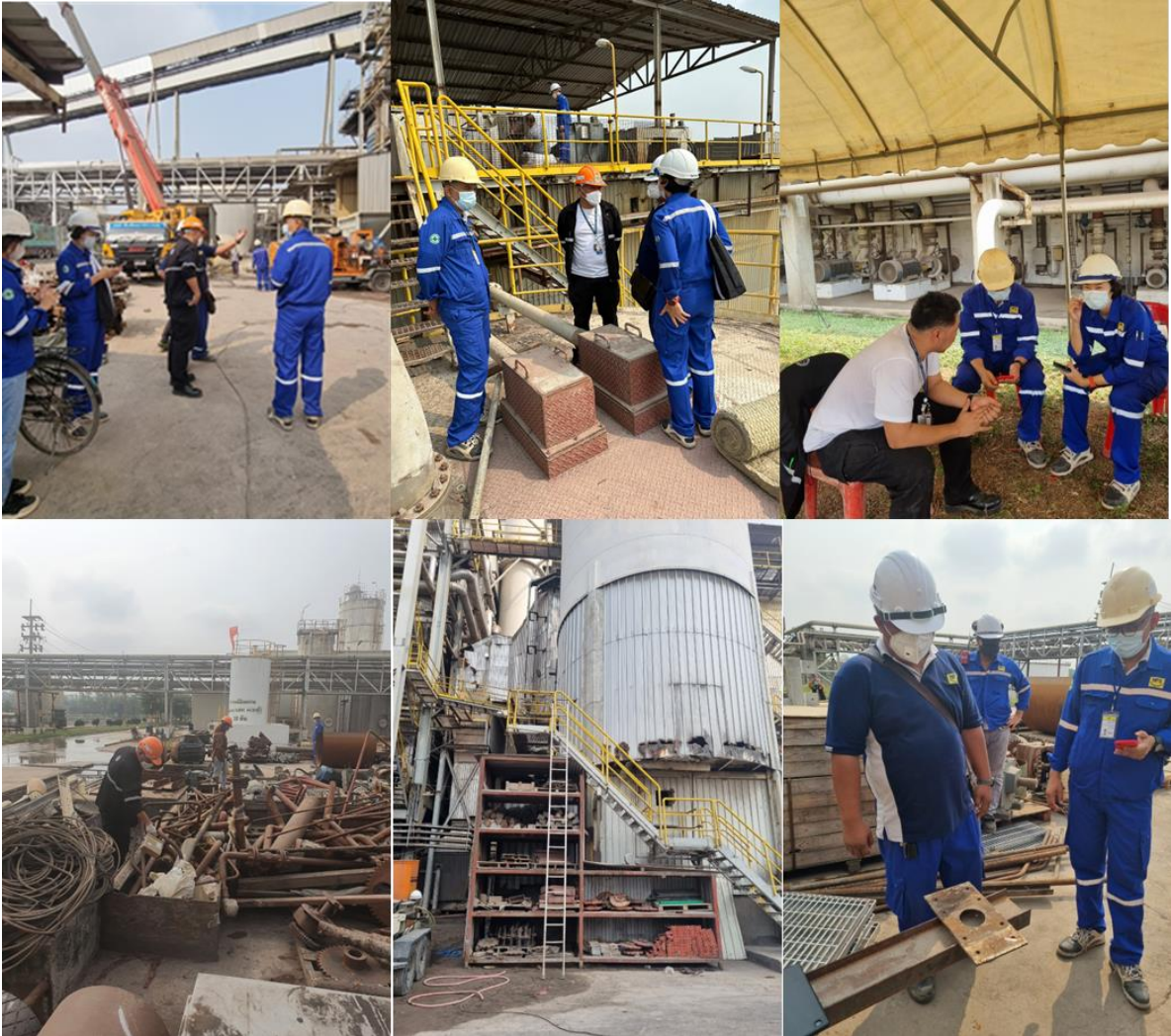
รูปภาพที่ ๒ แสดงการเข้าปฏิบัติงานของเจ้าหน้าที่ ปส. ในพื้นที่โรงงานฯ

แจ้งจากศูนย์อำนวยการป้องกันและบรรเทาสาธารณภัย กรมป้องกันและบรรเทาสาธารณภัย ว่าวัสดุแก๊สรั่วได้สูญหายจากบริษัทดังกล่าว ดังแสดงตามรูปภาพที่ ๒