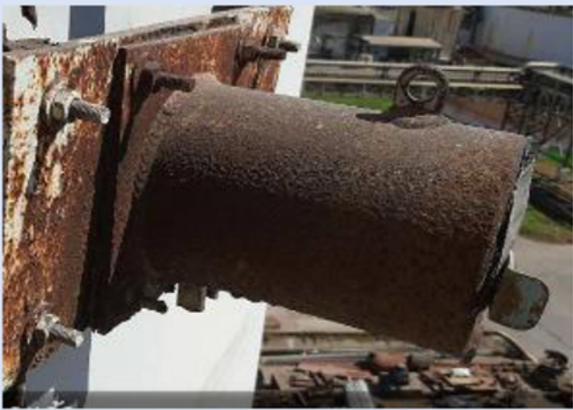
รูปภาพแสดงลักษณะของต้นกำเนิดรังสีที่สูญหาย

ต้นกำเนิดรังสีที่สูญหายนี้ มีลักษณะเป็นแท่งทรงกระบอก ภายนอกทำด้วยโลหะ ภายในประกอบด้วยตะกั่วสำหรับกำบังรังสี มีขนาดสูงประมาณ 20 – 30 เซนติเมตร และมีขนาดเส้นผ่านศูนย์กลาง ประมาณ 14 – 20 เซนติเมตร มีฐานทำด้วยแผ่นโลหะ ทรงสี่เหลี่ยมด้านเท่าเชื่อมติดอยู่ น้ำหนักประมาณ 25 กิโลกรัม